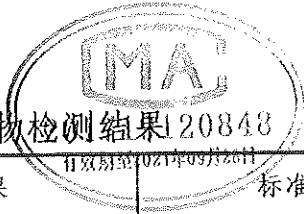
表 3-5 颗粒物检测结果 20848