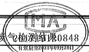
表 3-2 锅炉废气检测结果0848